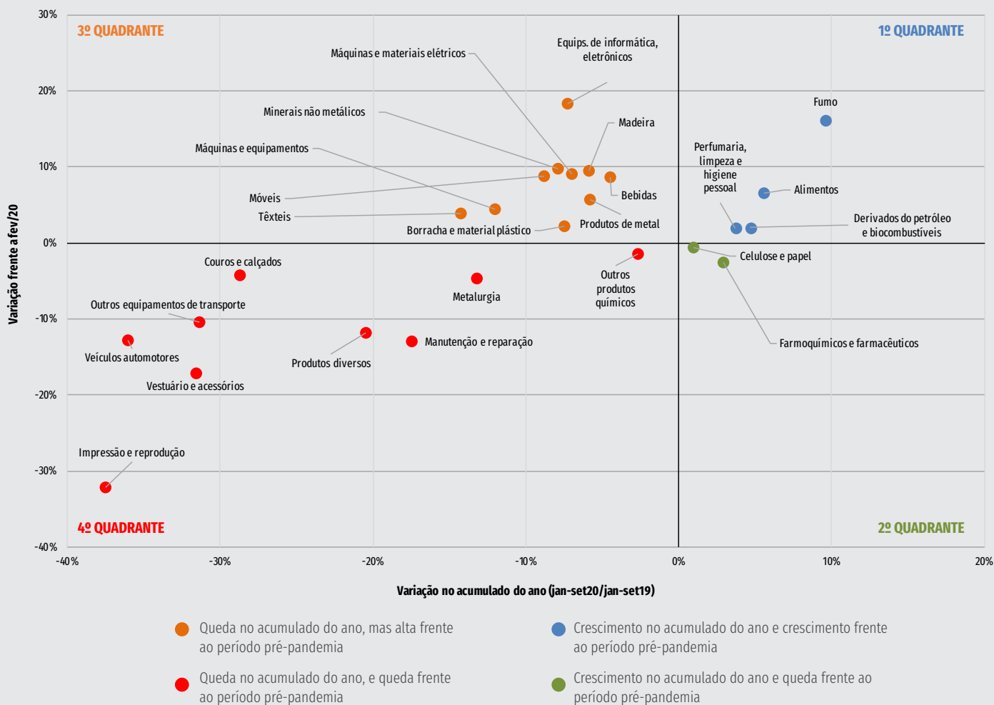
Gráfico 3 - Evolução da produção dos setores industriais em 2020