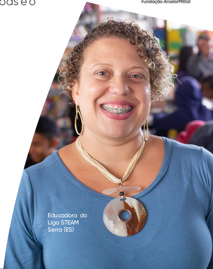
Educadora do Liga STEAM Serra (ES)

Preparação de profissionais para a Indústria 4.0