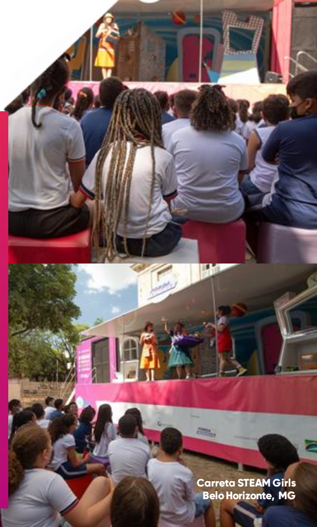
Carreta STEAM Girls Belo Horizonte, MG

Cerca de 17 mil pessoas participaram das ações.