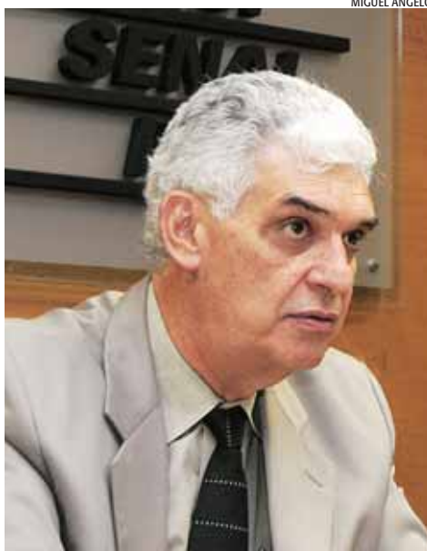
Benetti: se a educação básica não for boa haverá reflexo nas outras etapas de ensino

Ele explica que o ensino formal não tem capacidade de absorver a velocidade das transformações como as que ocorrem nas empresas. Surge então a necessidade de formar competências alinhadas com os