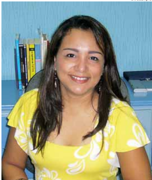
Cardna: preenchimento de milhares de fichas, à mão, exigia constantes conferências de dados