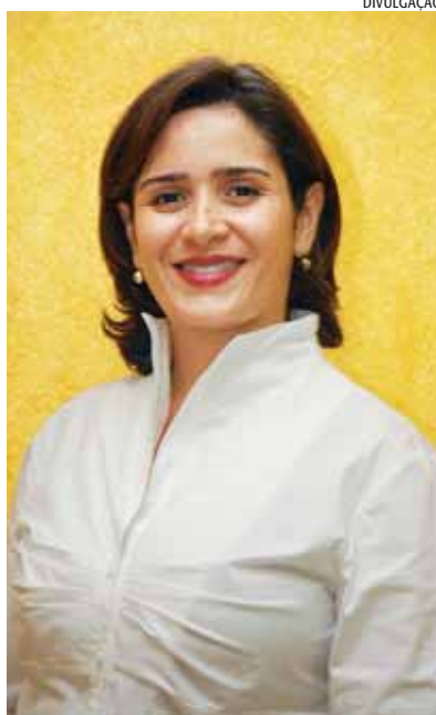
Gilane: organizar a casa para estabelecer novos desafios

No Estágio Supervisionado , por exemplo, sua intenção é estimular a aproximação entre os centros de