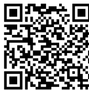
Site Prestação de Contas TCU SENAI