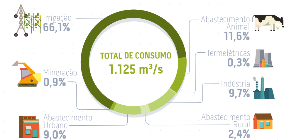
GRÁFICO 3 – Total de água consumida nas bacias hidrográficas (em 2019)