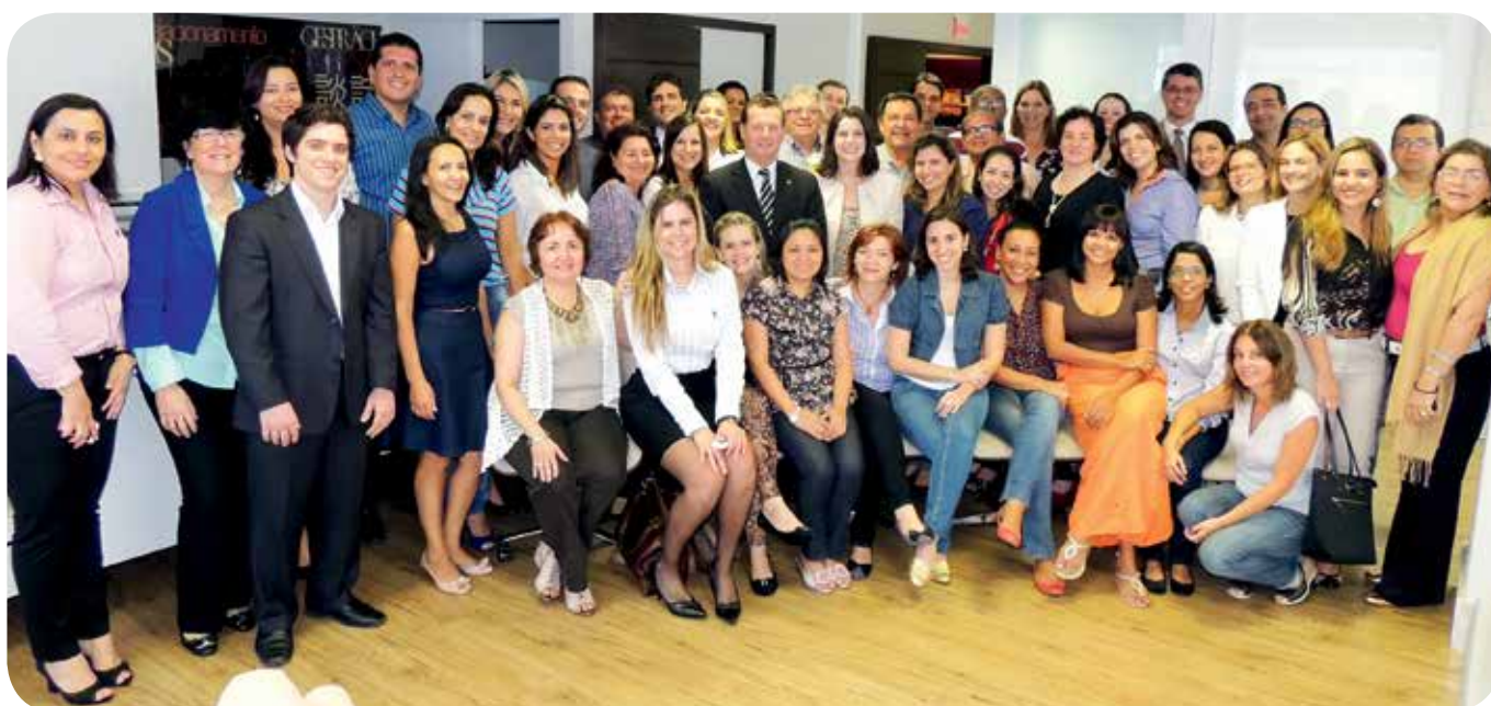
9º Encontro da Rede de Desenvolvimento Associativo

Desenvolver a liderança é o principal objetivo do 9º Encontro da Rede de Desenvolvimento Associativo, promovido pela Confederação Nacional da Indústria (CNI) em parceria com a Federação das Indústrias do Estado do Espírito Santo (FINDES), de 20 a 22 de março, em Pedra Azul (ES). Cerca de 60 gestores do Programa de Desenvolvimento Associativo (PDA) de todo o Brasil participarão do evento, que será fechado ao público.