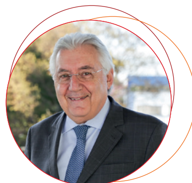
Guilherme Afif Domingos

Presidente da CNI Diretor do Departamento Nacional do SESI Presidente do Conselho Nacional do SENAI