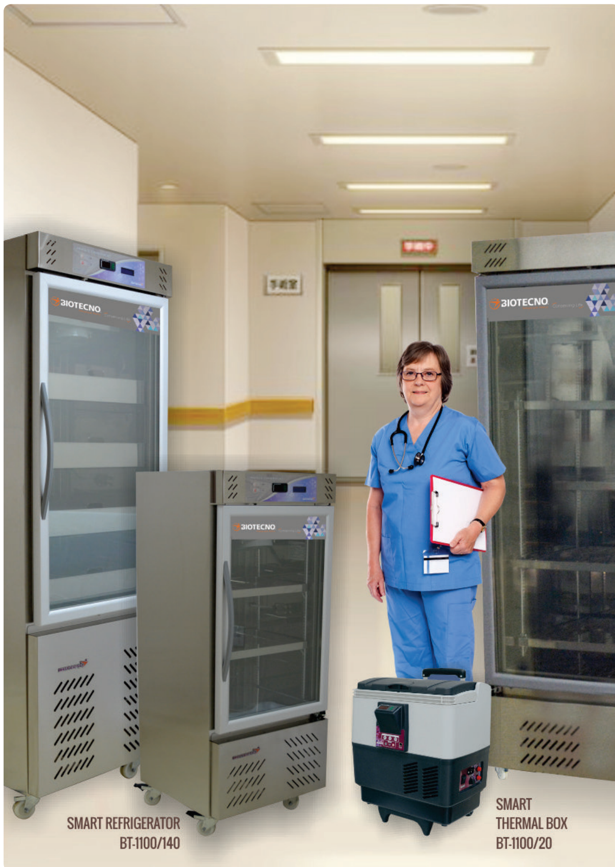
SMART REFRIGERATOR BT-1100/140