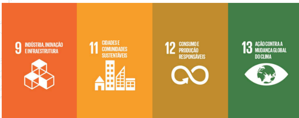
Figura 1: 4 ODSs alinhadas com o Regulamento