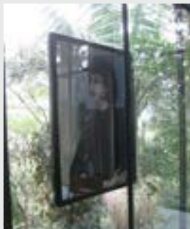
Projeto Casa de Vidro, 2013

A artista apresenta, em sua pesquisa informada pela tradição construtiva brasileira, o defrontar-se com a arquitetura dos espaços urbanos, ativando, assim, desde a constituição topográfica desses espaços, até um olhar crítico sobre as estruturas institucionais e sobre os espaços que nos cercam. O “Projeto de casa de vidro” (2013) fricciona a relação da obra de arte com o espaço onde se insere. Neste caso, o espaço são as obras arquitetônicas de Lina Bo Bardi. Para isso, a artista pendura do lado de fora da parede de vidro, na Casa de Vidro (casa projetada pela arquiteta Lina Bo Bardi para morar e atualmente sede do Instituto Lina Bo e P. M. Bardi), uma imagem que reaviva a presença da arquiteta na casa.