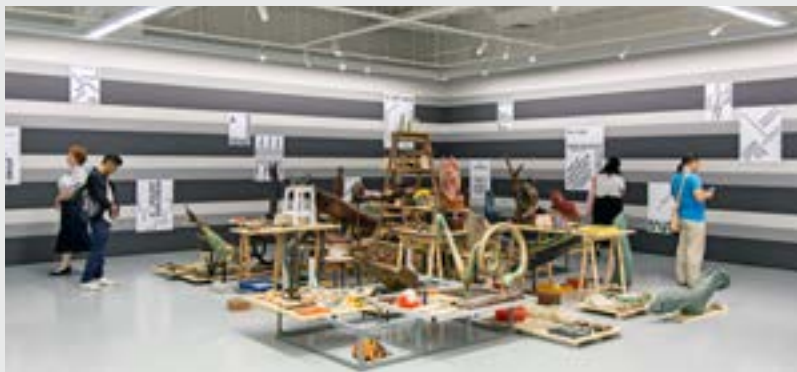
Novo mundo , 2019

Seus trabalhos têm como ponto de partida a observação sensível do entorno próximo, como a casa em que mora, ou de um contexto específico, como o museu que irá abrigar sua exposição. Na exposição “Novo Mundo” (2019), o artista partiu da observação sensível do entorno e criou sua obra a partir de quadros negros, bancos de metal, estantes de livros, restos de mesas de escritório e outros itens que estavam abandonados nos porões do museu. Nas paredes, foram pintadas listras horizontais em três tons de cinza diferentes e, sobre elas, posicionados 15 cartazes elaborados de trechos retirados do livro “Admirável Mundo Novo”, de Aldous Huxley.