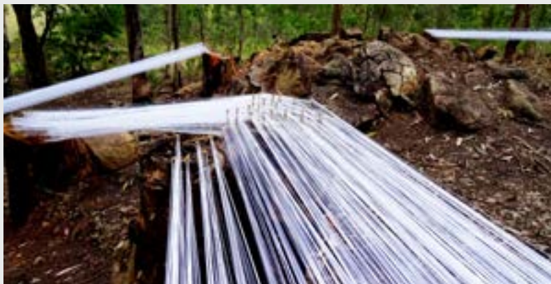
Arremate , 2015

A artista faz instalações trabalhando com papel e linha em vários espaços: na natureza, dentro dos ambientes de exposições, nas ruas etc. Ela diz que, quando vai sobrepondo os materiais e construindo o espaço, as formas que aparecem são resultantes dessas forças. Isso está presente em diversos trabalhos, como “Onda Seca” (2007), “Tabuleiro” (2013), “Arremate” (2015) e “Blanco Blanchot bla bla” (2017).