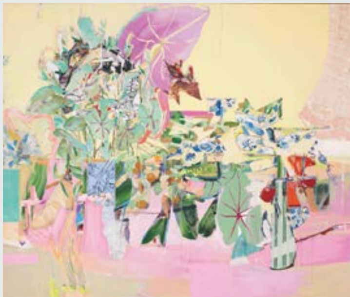
Paisagem n. 99 , 2017

De seu ateliê, a artista enfrenta as possibilidades da pintura. Suas paisagens não são naturalistas, mas centradas em rigorosa e vigorosa abstração formal. Compostas por linhas, planos e cortes dramáticos, suas pinturas levam o espectador ao encontro dos estilhaços do mundo contemporâneo. A artista expandiu sua vizinhança para o espaço do museu quando criou a tela “Paisagem” (2018) especialmente para expor no MASP.