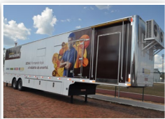
Unidade móvel Construção Civil