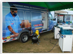
Unidade móvel Marcenaria