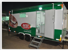
Unidade móvel Odonto

> 10 unidades móveis 248 trabalhadores atendidos 2,1 mil procedimentos