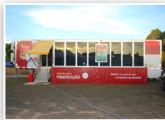
Unidade móvel Panificação