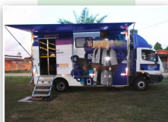
Unidade móvel Informática

A fim de poder levar seus produtos e serviços cada vez mais longe e interiorizar suas ações para alcançar o maior número de indústrias possível, o Sistema FIEAC recebeu, só neste ano, 6 unidades móveis, totalizando 10. Quatro delas pertencem ao SENAI – panificação, construção civil, eletroeletrônica e marcenaria. As outras seis são de serviços do SESI, sendo duas de laboratório de informática, uma de audiometria, uma de consulta ocupacional, odontologia e Cozinha Brasil. E por falar em unidades móveis, em 2013, o trailer odontológico do SESI prestou atendimento no chão de fábrica para 248 trabalhadores da indústria, realizando 2,1 mil procedimentos.